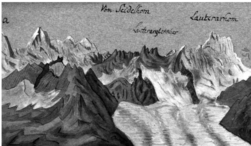
Rkps 415, Widok szczytów Alp zamieszczony w „Dzienniku z podróży do Szwajcarii” ok. 1830 r.