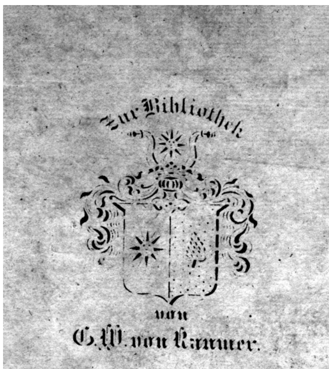
Exlibris Georga Wilhelma von Raumera zamieszczony na wewnętrznej okładce książki z księgozbioru von Raumera