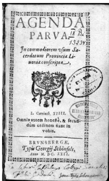
II.3 Karta tytułowa jedyne na świecie egzemplarza Agenda Parva (Braniewo 1622).