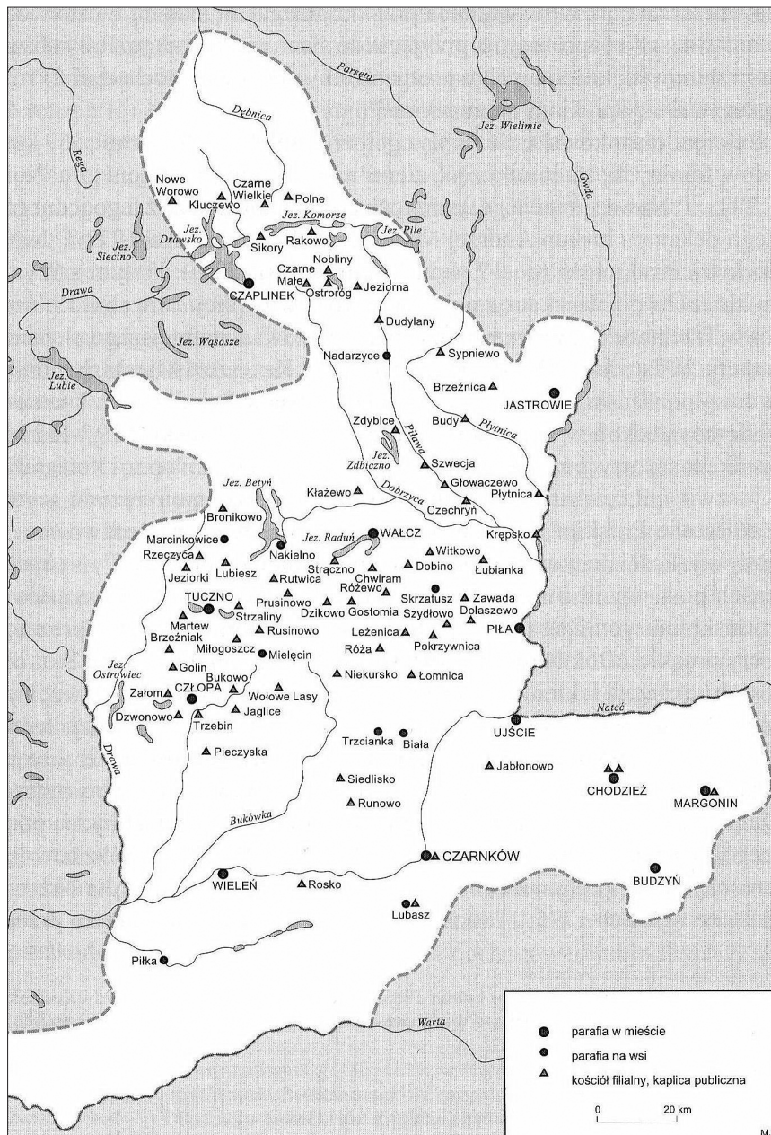
Mapa 1. Dekanat czarnkowski w połowie XVIII wieku

Na podstawie: S. Litak, Kościół łaciński w Rzeczypospolitej około 1772 roku. Struktury administracyjne , Lublin 1996; S. Litak, Struktura terytorialna Kościoła łacińskiego w Polsce w 1772. Mapy , Lublin 1980, opracowanie kartograficzne Maria Juran.