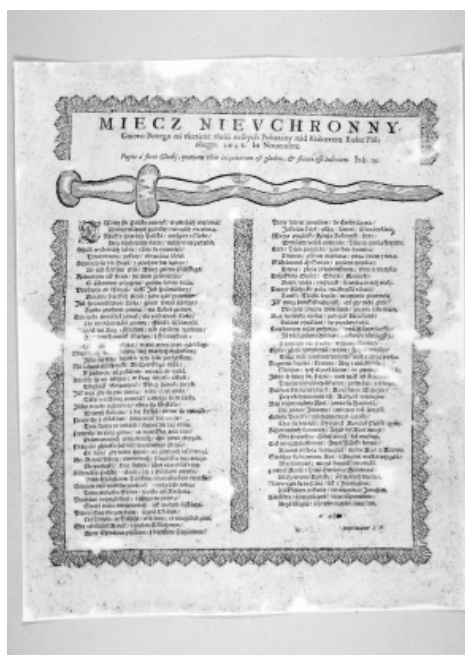
Il. 6. Druk ulotny pt. Miecz nieuchronny Gniewu Bożego na ukaranie złości naszych pokazany nad Krakowem Roku Pańskiego 1648 . Stan po konserwacji.