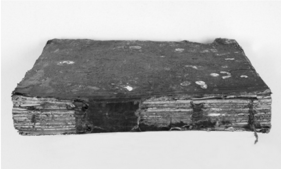
Il. 1. Rękopis, w okładzinach którego odnaleziono arkusze wydawnicze Traktatu... Stan przed konserwacją.