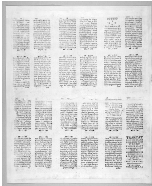
Il. 2. Jeden z dwóch arkuszy wydawniczych. Stan po konserwacji.