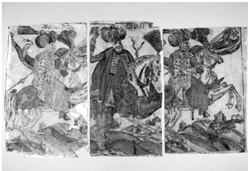
Il. 7. Fragmenty koltryn odnalezionych w starym druku z 1665 roku. Stan przed konserwacją