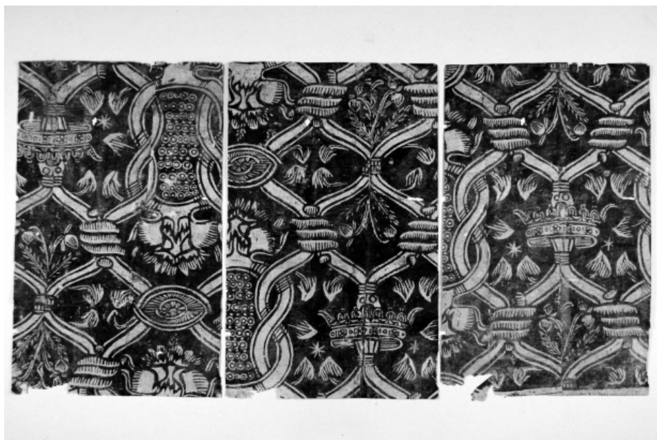
Il. 8. Fragmenty koltryn odnalezionych w starym druku z 1665 roku. Stan przed konserwacją