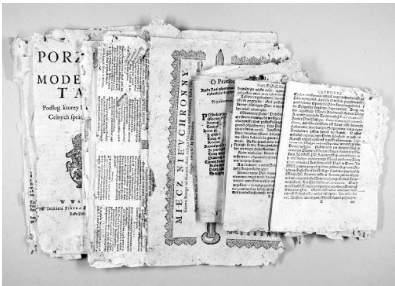
Il. 5. Karty wydobyte z okładin starego druku: De Inchyto Agone Martyrij