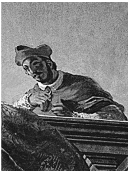
Fot. 1. Nuncjusz Giovanni Battista Lancellotti

Fresk w willi Lancellottich we Frascati koło Rzymu wykonany przez Domenico Forti w latach 1873-1884