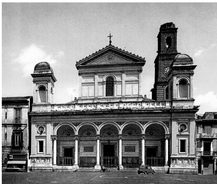
Fot. 2. Nola – katedra

Fresk w willi Lancellottich we Frascati koło Rzymu wykonany przez Domenico Forti w latach 1873-1884