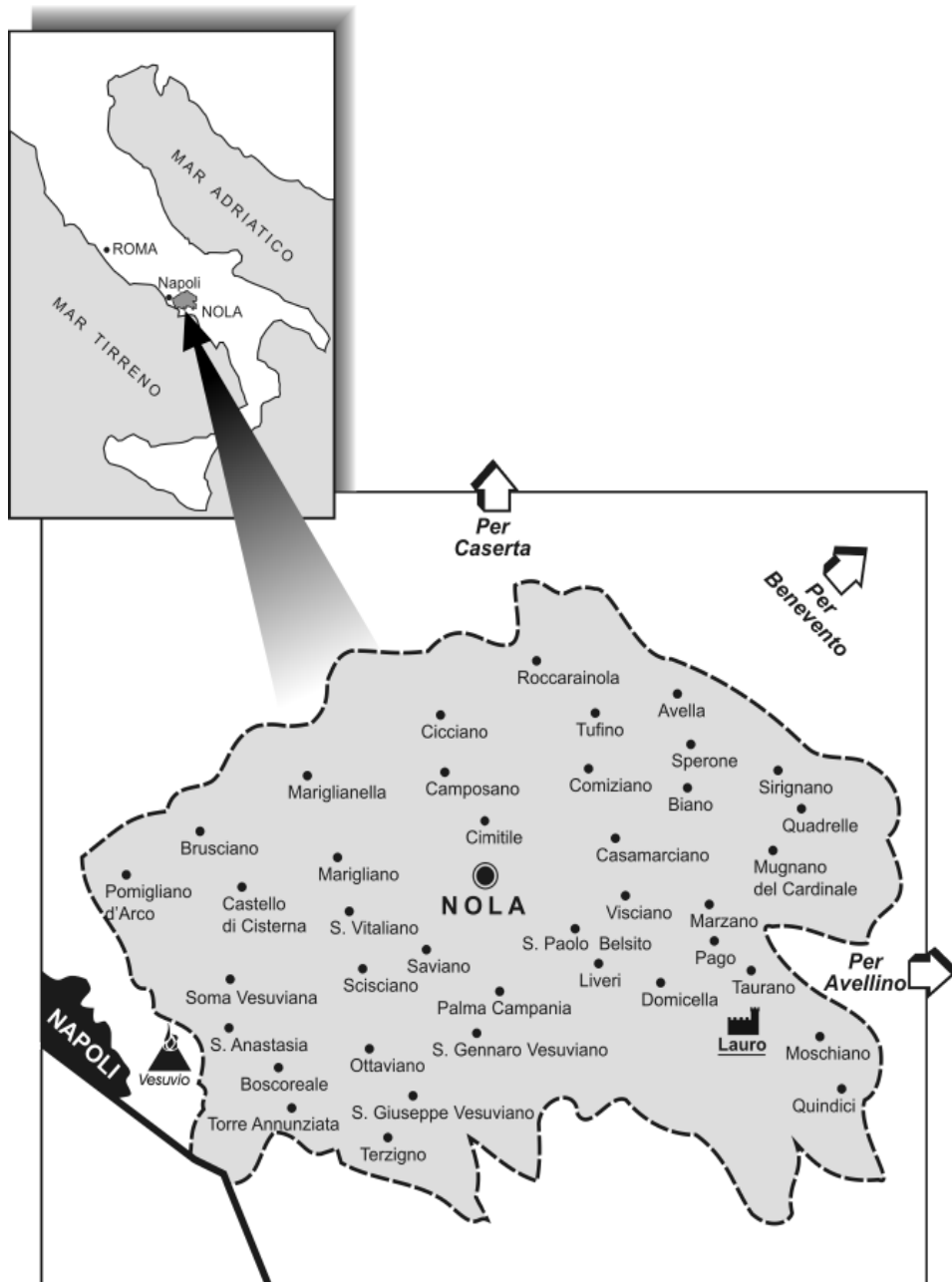
Mapa 1. Przybliżone granice diecezji Nola w XVII wieku

Odtworzono na podstawie stanu z 1492 roku opisanego przez Ambrogio Leone, De Nola Patria , Venezia 1514, lib. 1, cap. 10, a znowelizowano w oparciu o dane zaczerpnięte z siedemnastowiecznych relacji biskupich