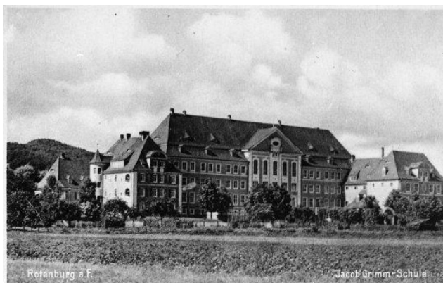
Il. 2. Jacob Grimm Schule, pocztówka z ok. 1930 r.

Fotografia została wykonana na tle budynku szkoły znajdującej się w Rotenburgu Jacob Grimm Schule 23 . Pod koniec sierpnia 1939 r., tuż przed wybuchem II wojny światowej w budynku szkolnym powstał szpital wojskowy. Od 1 grudnia 1939 r. budynek został przekształcony na obóz jeniecki dla ponad 400 polskich oficerów i kilkudziesięciu polskich kapelanów wojskowych.