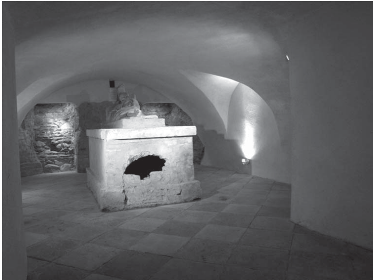
Fot. 6. Krypty w kościele pw. Znalezienia Krzyża Świętego.