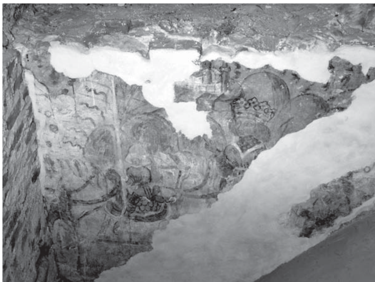
Fot. 3. Muzeum w wieży kościoła pobrygidkowskiego w Lublinie. Polichromia XV w.