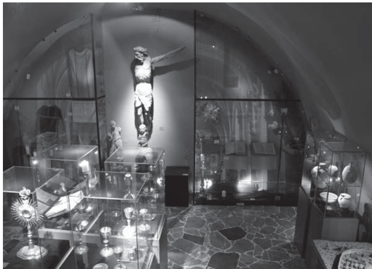
Fot. 4. Muzeum w Wąwolnicy.