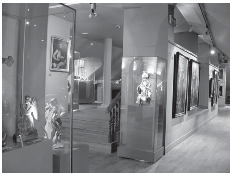
Fot. 2. Muzeum 200-lecia Diecezji.