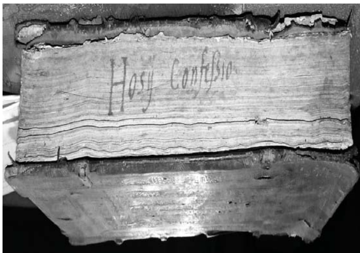
Fot. 1. Skrócony zapis tytułu na brzegu bloku jednego z wiślickich starodruków/ Brief record of the title on the edge of one of the antique books from Wiślica