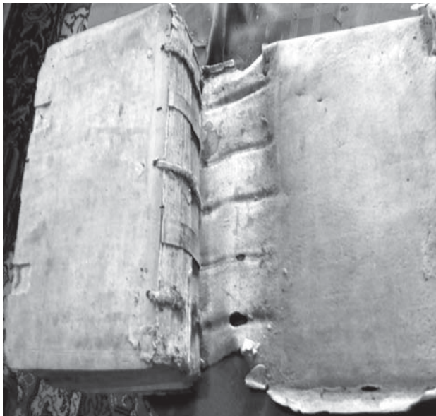
Fot. 4. Obecny stan jednego z wiślickich starodruków, skórzana oprawa dolnego bloku odspojona od drewnianych okładek/ The current state of one of the antique books of Wiślica, the leather binding of the lower part of the book coming off the wooden covers