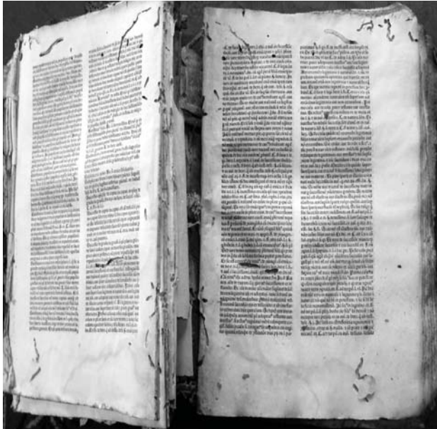
Fot. 3. Obecny stan zniszczonego klocka, w którym współprawnie dwa wiślickie inkunabuły/ The current state of the destroyed books bound together, including two incunabula of Wiślica