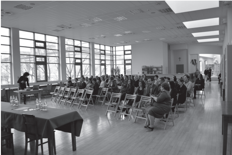
Fot. 1. Uczestnicy konferencji Problemy nowoczesnej biblioteki naukowej: konferencja w 40. rocznicę śmierci dr hab. Romualda Gustawa OFM .