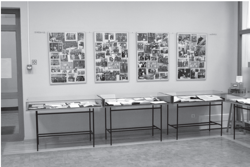
Fot. 6. Fragment wystawy „ Cale życie wśród książek ”. Pamięci Ojca Dyrektora Romualda Gustawa w 40. rocznicę śmierci .