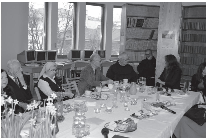
Fot. 8. Uczestnicy wieczornicy poświęconej pamięci o. R. Gustawa.