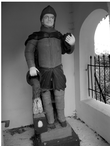
Fot. 7. Figura św. Floriana w kapliczce w Rzeczycy Ziemiańskiej.