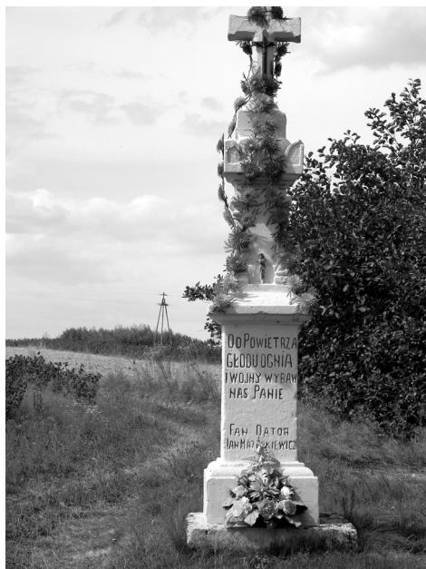
Fot. 5. Krzyż postumentowy w Rzeczycy Ziemiańskiej.