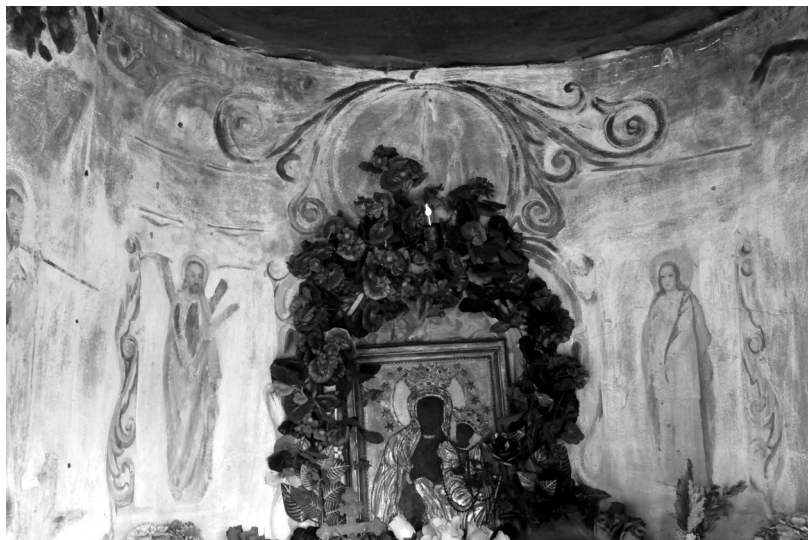
Fot. 9. Wnętrze kapliczki Matki Boskiej Częstochowskiej w kapliczce rodziny Wójcików w Lychowie Gościeradzkim, 1847 r.