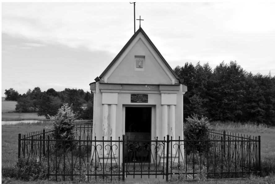
Fot. 1. Kapliczka Matki Boskiej Częstochowskiej w Łychowie Gościeradowskim, fundacja Andrzeja i Doroty Wójcików, 1847 r.