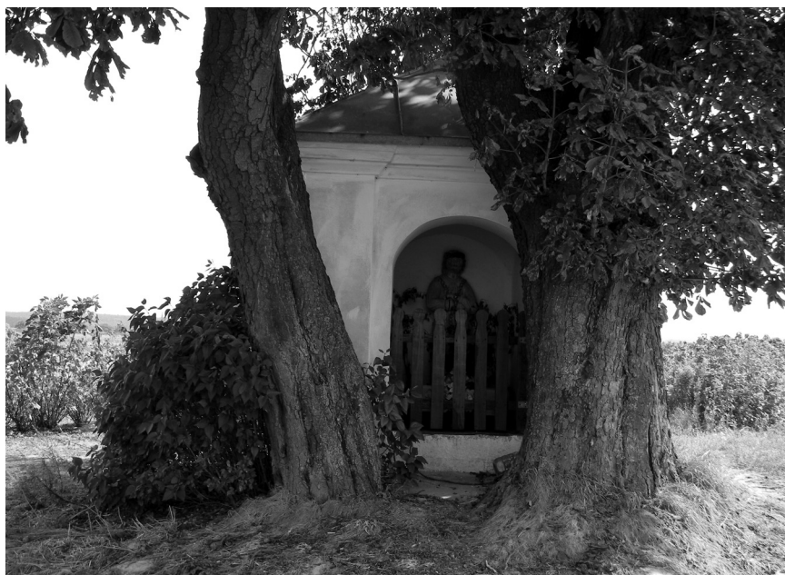
Fot. 2. Kapliczka domkowa w Owczarni.