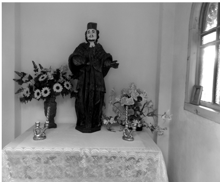
Fot. 6. Drewniana figura św. Jana Nepomucena w kapliczce w Liśniku Małym.