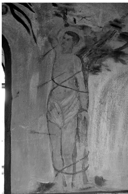
Fot. 10. Św. Sebastian, fragment polichromii w kapliczce w Lychowie Gościeradzkim, 1847 r.