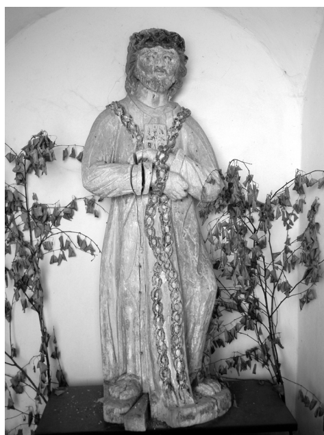
Fot. 8. Drewniana figura Chrystusa prowadzonego na Mękę w kapliczce w Owczarni.