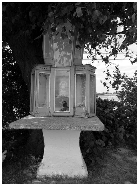
Fot. 4. Kapliczka szafkowa w Owczarni.