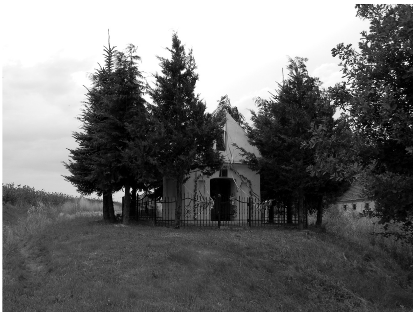
Fot. 12. Kapliczka fundacji rodziny Pytlaków w Lychowie Szlacheckim, 1856 r.