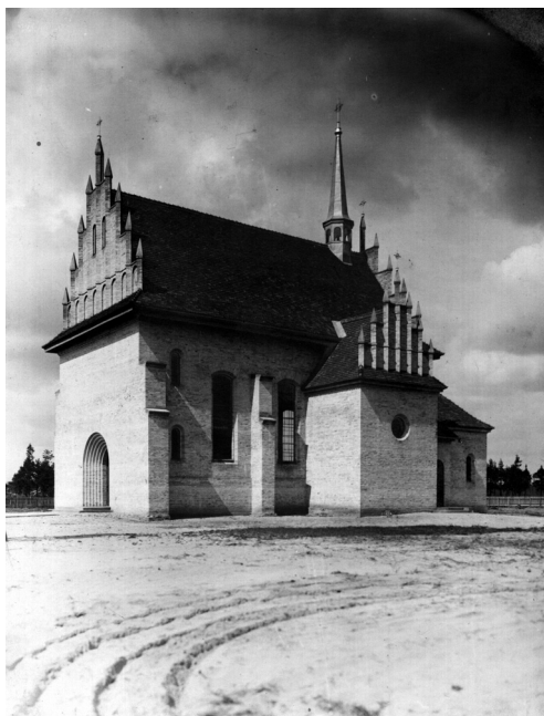
Fot*. 1. Widok zewnętrzny kościoła parafialnego pw. Matki Bożej Królowej Korony Polskiej w Mikaszewiczach, 1936 r.