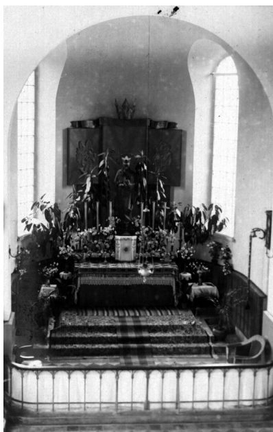
Fot. 2. Ołtarz główny w kościele parafialnym pw. Matki Bożej Królowej Korony Polskiej w Mikaszewiczach, 1936 r.