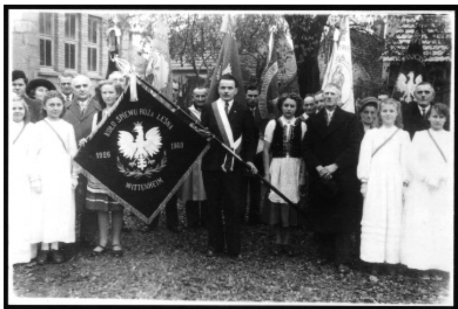
Il. 4. Stowarzyszenie „Róża Leśna”, Wittenheim, 1950