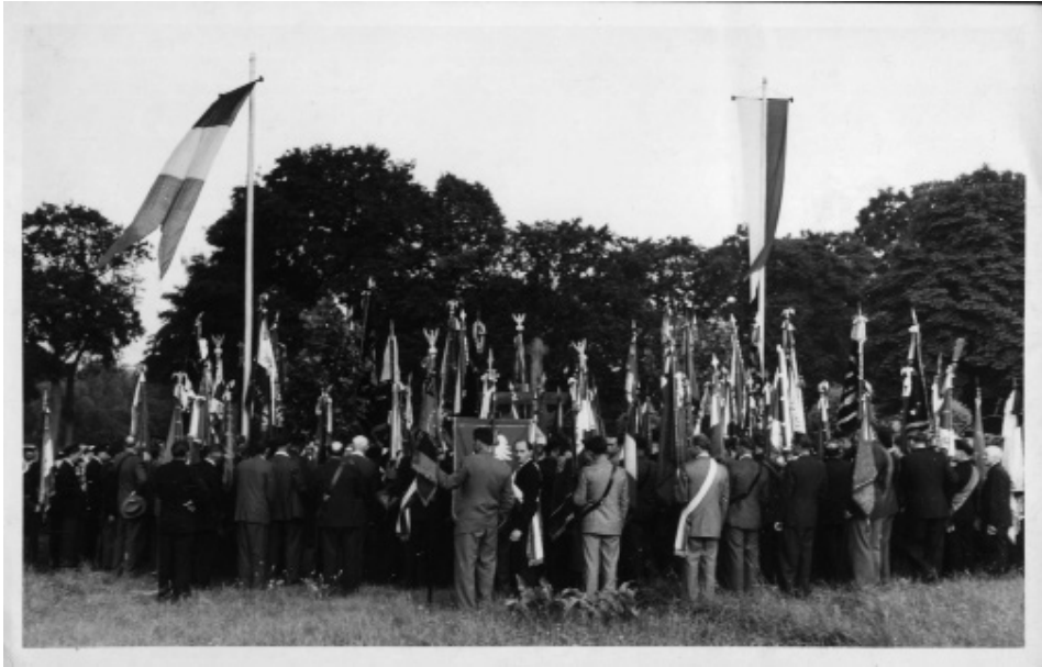
Il. 1. Hold dla żołnierzy pierwszej dywizji polskiej Dieuze, 26 czerwca 1955 r.