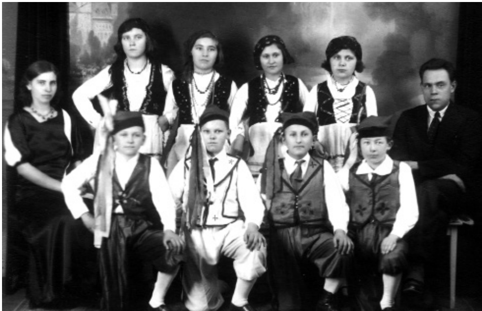
Il 2. Jedno z polonijnych stowarzyszeń tanecznych, Wittenheim, 1953 r., APMK, Dokumentacja Jean Chęcińskiego, Zbiory luźne