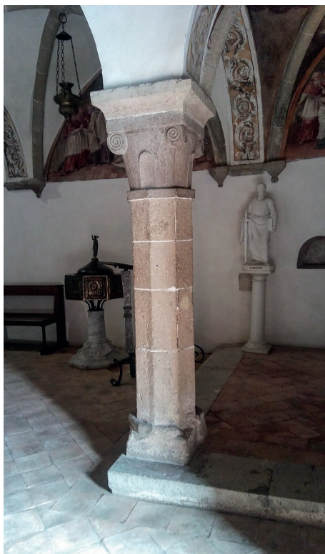
Il. 3. Wnętrze kościoła, w głębi figura św. Pawła, autorstwa Tomasza Oskara Sosnowskiego