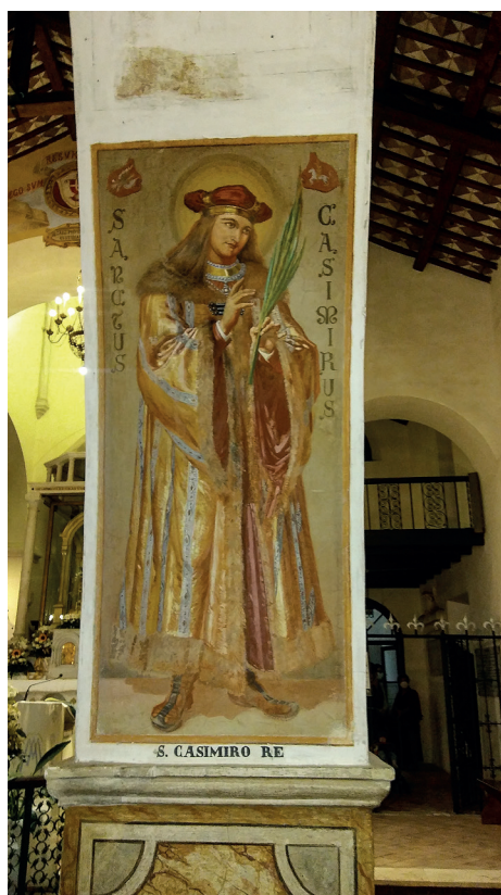
Il. 2. Wnętrze kościoła z freskiem przedstawiającym św. Kazimierza królewicza