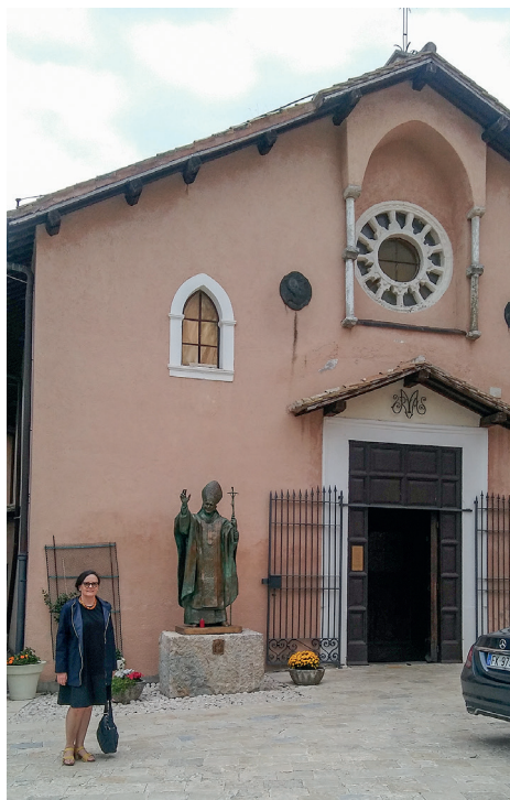
Il. 1. Autorka artykułu przy wejściu do sanktuarium; z lewej pomnik św. Jana Pawła II – dar lokalnej społeczności