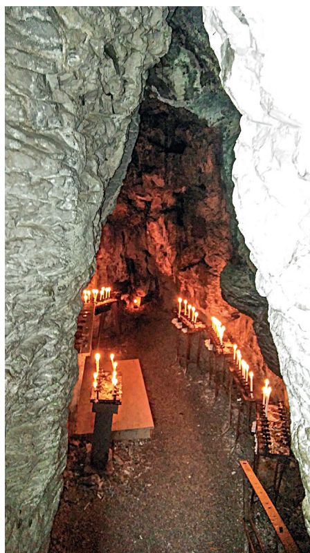
Il. 6. Grota św. Benedykta, fot. A. Bender