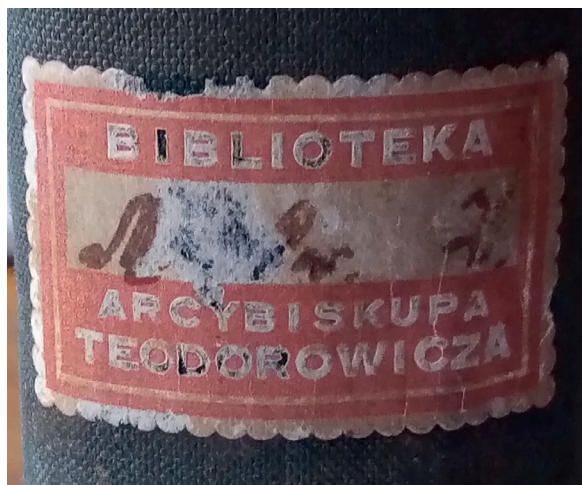
II. 5-8. Pieczętki z księgozbioru abp. Józefa Teodorowicza