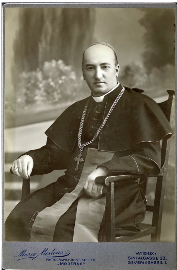
Il. 1. Arcybiskup ormiański Józef Teodorowicz (1864-1938), Wiedeń 1910

przedmiotem rozlicznych studiów i rozpraw naukowych. Szerokie horyzonty hierarchy i zainteresowania znajdują odzwierciedlenie w obszernym księgozbiorze, który zgromadził. Jego biblioteka była imponująca zarówno pod względem różnorodności tematyki literatury, czasopism, broszur i innych publikacji, jak również rzadkich starodruków i cennych rękopisów stanowiących wyjątkowe rarytasy bibliofilskie. Szacowana na kilkanaście tysięcy tytułów, księżnica była z całą pewnością najobszerniejszą w owych czasach biblioteką należącą do Ormianina 2 . Dotychczas uwaga badaczy skupiała się na starodrukach pochodzących z kolekcji J. Teodorowicza 3 , tymczasem unikatowy i cenny księgozbiór, jego zawartość treściowa oraz tragiczne losy z okresu II wojny światowej zasługują na szczegółowe omówienie. Powyższe cele badawcze zrealizowane zostaną klasyczną metodą historyczną poprzez analizę i krytykę materiału źródłowego.