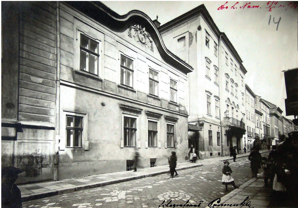
Il. 2. Pałac arcybiskupów ormiańskich we Lwowie przy ul. Ormiańskiej 7 w okresie I wojny światowej

Drugi katalog (maszynopis), ułożony alfabetycznie, składa się z 1250 kart i zawiera nazwisko autora, tytuł/tytuły publikacji, sygnaturę (nie podano roku i miejsca wydania) 18 i jest przypuszczalnie kontynuacją wspomnianego wyżej rękopiśmiennego. Trzeci katalog, tytułowy (maszynopis), liczy 115 kart 19 . Do naszych czasów zachowało się zatem 3200 kart inwentarzowych, co stanowi ok. ¼ przedwojennego zasobu. Nie mamy dowodów na to, w jakim stopniu zgromadzony przez hierarchę księgozbiór został skatalogowany. Pytanie to jest zasadne z uwagi na rozbieżność danych liczbowych na temat wielkości ksiąźnicy.