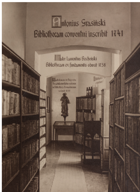
Il. 1. Wnętrze Biblioteki Bernardynów, widok w kierunku północnym, fotografia z drugiej połowy lat 30. XX wieku