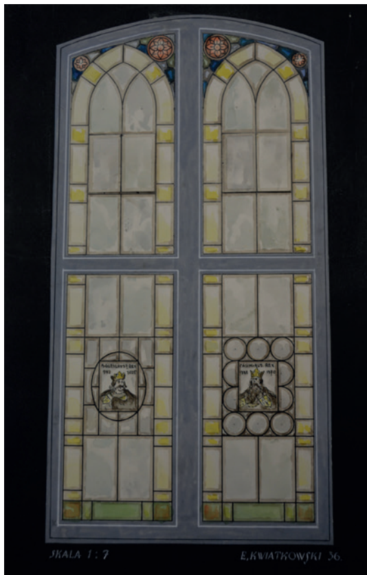
Il. 11. Projekt witraża z wizerunkami królów Bolesława Chrobrego i Kazimierza Wielkiego, autor E. Kwiatkowski, 1936, ze zbiorów WiMBPB