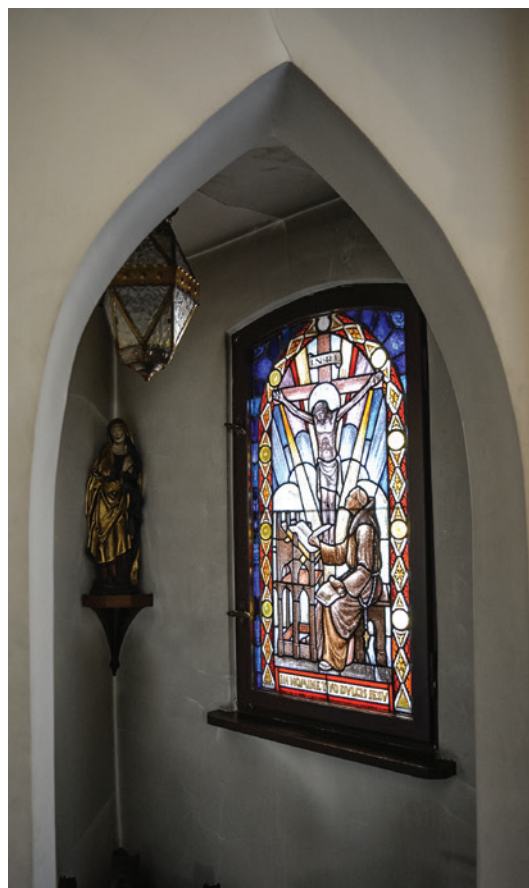
Il. 7. Pomieszczenie w skraju południowo-zachodnim Biblioteki Bernardynów, stan obecny, fot. A. Wysocka, 2022

rozglifiony otwór zamknięty łukiem ostrym 29 . We wnętrzu umieszczono na konsoli późnogotycką rzeźbę Niezidentyfikowanej Świętej 30 i XVII-wieczną skrzynię pochodzącą ze zbiorów bydgoskiego kolekcjonera Romana Stobieckiego 31 . Po obu