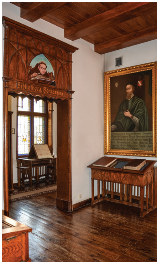
Il. 6. Wejście do Biblioteki Bernardynów. Nad wejściem wizerunek ks. Jana Kleina (autor J. Rupniewski), na ścianie z prawej strony portret Tomasza Ujejskiego, stan obecny, fot. A. Wysocka, 2022