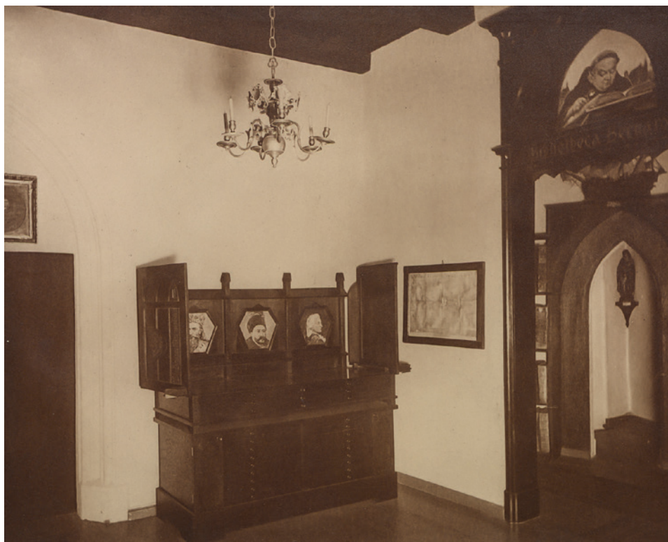
Il. 9. Gablota z wizerunkami władców Polski, fotografia z drugiej połowy lat 30. XX wieku