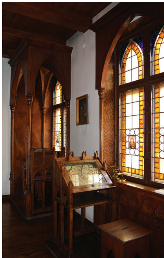
Il. 10. Fragment Sali Królewskiej, stan obecny, fot. A. Wysocka, 2022

(...) w okna wprawiono piękne witraże. Robił je młody, lecz wielce utalentowany witrażysta bydgoski p. Kwiatkowski. Sprowadza szkło z zagranicy na miejscu wykonuje witraże sam w myśl własnych projektów 48 .