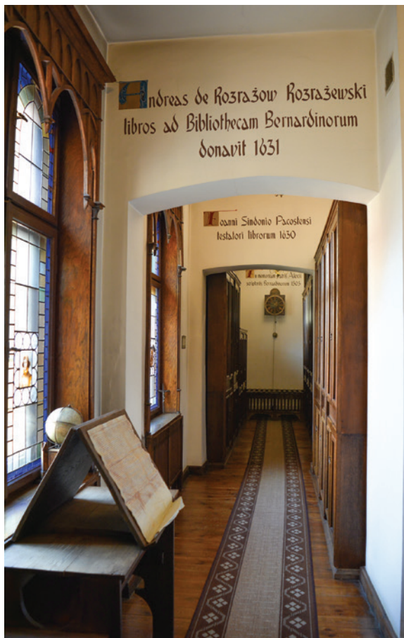
Il. 3. Wnętrze Biblioteki Bernardynów, widok w kierunku południowym, stan obecny, fot. A. Wysocka, 2022

Od 1907 roku do 1920 roku, kiedy Bydgoszcz wróciła w granice państwa polskiego, księgozbiór przechowywany był w Bibliotece Miejskiej (Stadtbibliothek), w pomieszczeniach gospodarczych kościoła pw. Świętej Trójcy i nad zakrystią w kościele farnym pw. Świętych Mikołaja i Marcina 5 . W 1922 roku Dozór Kościelny archidiecezji gnieźnieńskiej „zdecydował pozostawić Bibliotekę Bernardyńską w Bydgoszczy i przekazać jako wieczysty depozyt Bibliotece Miejskiej w Bydgoszczy” 6 .