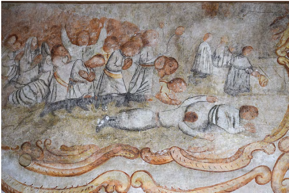
Il. 1. Pasja bracka, fresk z lat 60. XVIII wieku na północnej ścianie nawy głównej kościoła w Stryszowie