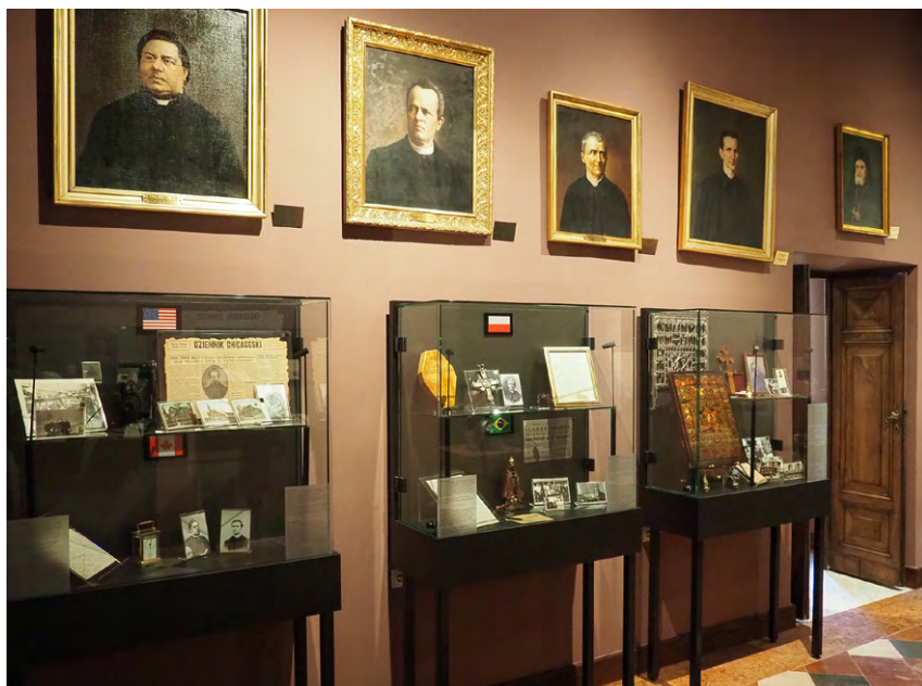
IL. 8. Muzeum – widok obecny. Sala 3. Gabloty z pamiątkami z różnych prowincji zmartwychwstańców

Aranżacja sali trzeciej podporządkowana jest poszczególnym prowincjom zmartwychwstańców na różnych kontynentach. W kilku gablotach zaprezentowano historię i działalność zgromadzenia w wielu rejonach świata, umieszczono tam pamiątki usystematyzowane według regionów 29 (il. 8).