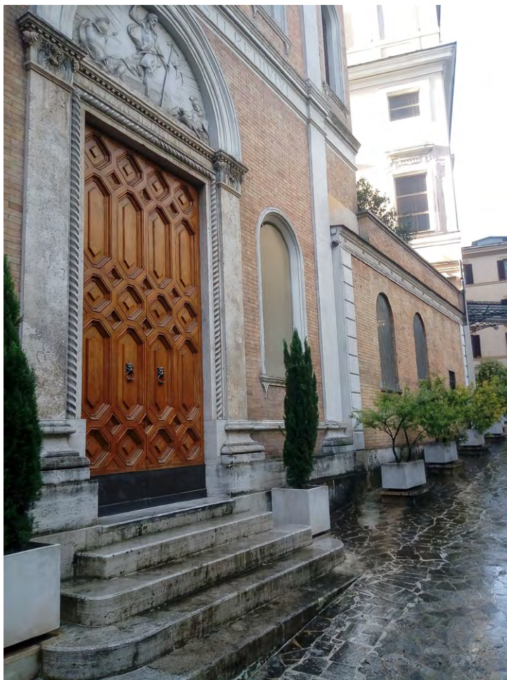
Il. 1. Widok kościoła i klasztoru w Rzymie przy via San Sebastiano 11

Chociaż w Wiecznym Mieście jest wiele miejsc związanych ze zmartwychwstańcami, to najważniejszym pozostaje klasztor przy via San Sebastiano 11. Posesję, będącą niegdyś zajazdem dla podróżnych, wraz z dużą działką zakupił w 1886 roku P. Semenenko 6 . Budynek został dostosowany do potrzeb zgromadzenia. Do głównego gmachu dodano jedno piętro, zaś nad oficynami wzniesiono dwie kondygnacje (il. 1).