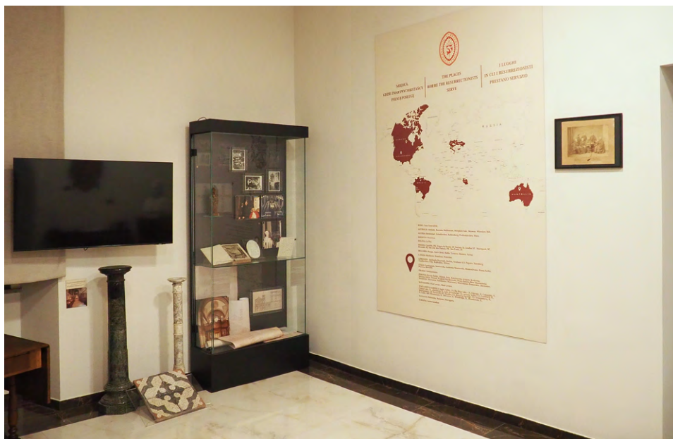
Il. 3. Muzeum – widok obecny. Sala 1. Pozostałości architektoniczne po przebudowie kościoła