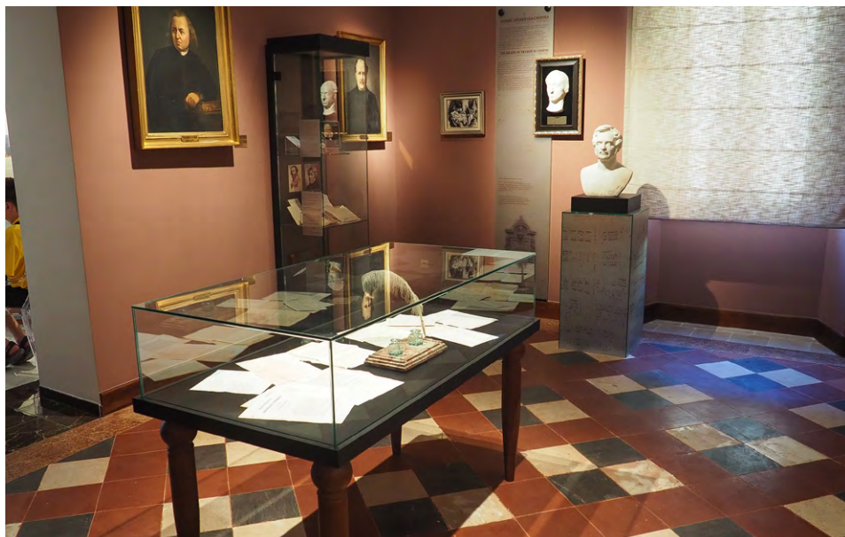
IL 5. Muzeum – widok obecny. Sala nr 2. Gabłota z kopiami archiwaliów, m.in. korespondencji, sprawozdań ze spotkań organizowanych w Paryżu przez głównych przedstawicieli Wielkiej Emigracji, w tym późniejszych założycieli zakonu

Ekspozycja w kolejnej sali poświęcona jest Wielkiej Emigracji. „Opowiedziane” tu zostały losy wygnańców, zmuszonych opuścić ojczyznę po klęsce powstania listopadowego. Pośrodku, w ustawionym stole-gablocie, zaprezentowano kopie wybranych archiwaliów, m.in. korespondencji, sprawozdań ze spotkań organizowanych w Paryżu przez głównych przedstawicieli Wielkiej Emigracji, w tym późniejszych założycieli zgromadzenia (il. 5).