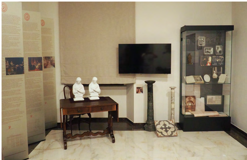
Il. 4. Muzeum – widok obecny. Sala 1. Modele gipsowe Matki Bożej Niepokalanie Poczętej autorstwa Oskara Tomasa Sosnowskiego

W tej sali znalazło się też miejsce dla uczczenia wielkiego rzeźbiarza Tomasa Oskara Sosnowskiego, wyeksponowano dwa modele gipsowe Matki Bożej Niepokalanie Poczętej, obydwa wykonane w latach 1854-1855. Warto nadmienić, że po śmierci artysty prawie wszystko, co pozostało w jego pracowni, trafiło do rzymskich zmartwychwstańców 26 (il. 4).