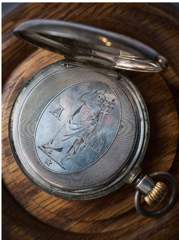
Fot. 6. Chronometr, połowa lat 70 XIX wieku, Antoni Patek

Sebastianello zgromadzono piętnaście listów A. Patka datowanych na lata 1847-1876. Dotyczą one głównie spraw bieżących. Jedną z najcenniejszych pamiątek, którą można obejrzeć, jest wspaniały chronometr jego autorstwa. W muzeum na ekspozycji znajduje się egzemplarz z połowy lat 70. XIX wieku, który należał do ks. Semenki, подарowany przez autora. Egzemplarz o tyle ciekawy, że koperta nie jest wykonana ze złota, w przeciwieństwie do większości zegarków Patka, a ze srebra próby 800. Wnętrze koperty typu half hunter zdobi przedstawienie Chrystusa Zmartwychwstałego, u którego stóp widnieje gwiazda pięcioramienna. Po bokach artysta umieścił litery A i Ω (Chrystus wczoraj i dziś; początek i koniec). Grawer ten jest bez wątpienia unikatowy. Nie udało się znaleźć podobnego 28 (il. 6).