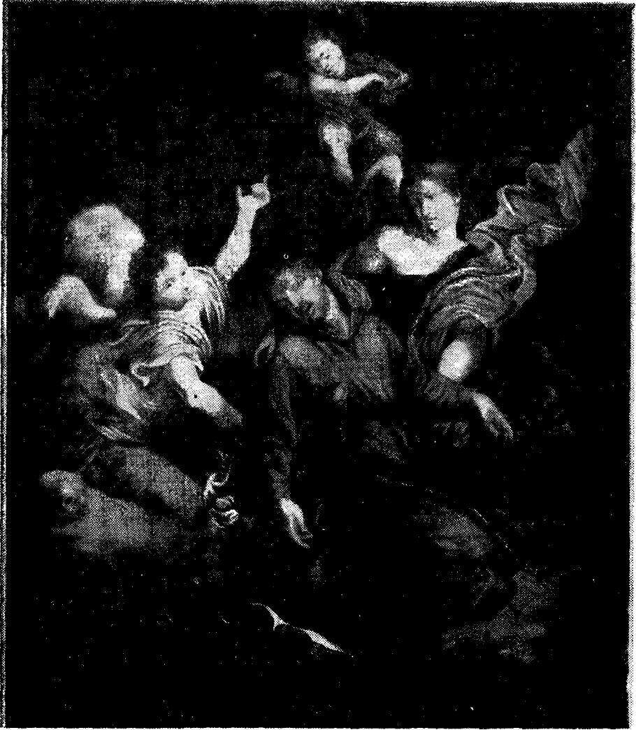
Omdlenie św. Franciszka (124)

Bibliografia: APK, rkps — Br. E. Chmiel: Kronika s. 154. — Thieme u. Becker, VI 481—482. — Bénézit, II 483: „Messa cantata et Esequie d'un Cappuccino, conservés à l'Academie de Florence”. — Nagler, II 516.