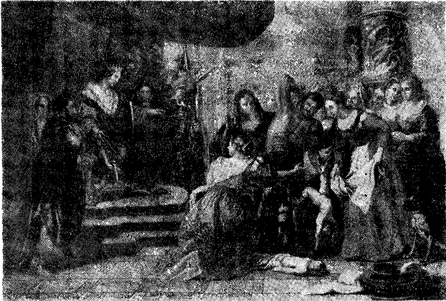
Sąd Salomona (62)

stołkiem, wkłada sandały. Między nim a Panem Jezusem stoi Matka Boska w niebieskiej sukni i czerwonym płaszczu. Z sufitu zwisa złoty żyrandol. Tło żółtoczerwone i zielone. Prawdopodobnie szkoła wenecka. XVII w.