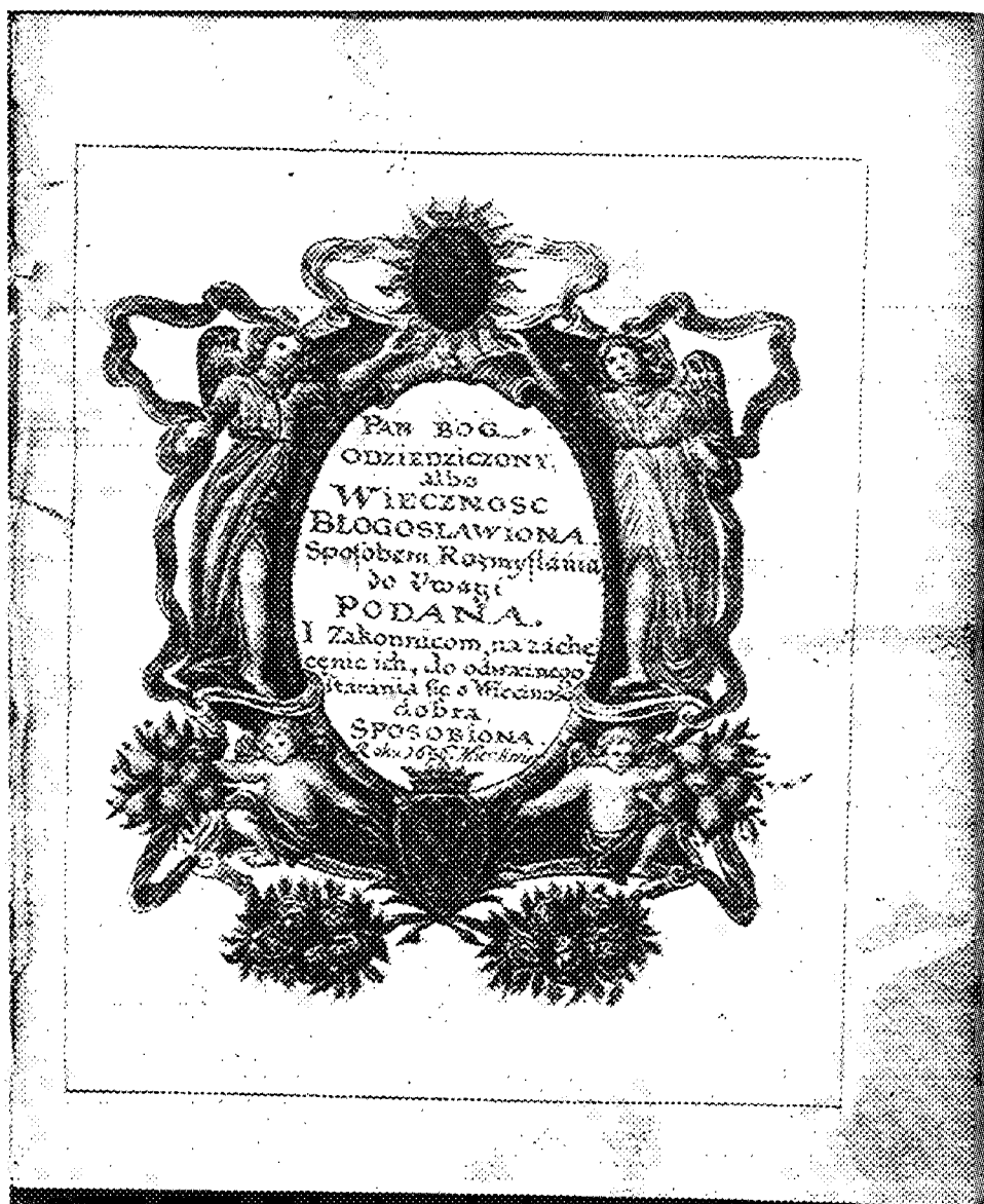
Karta tytułowa zbioru rozmyślań, sygn. 4