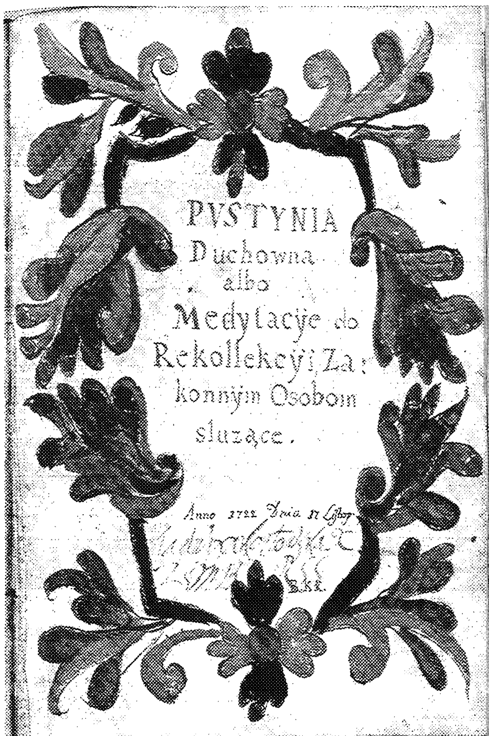
Karta tytułowa zbioru medytacji, sygn. 32