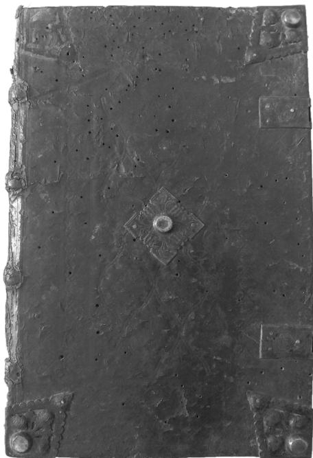
Il. 1. Okładzina górna klocka zawierającego współprawne inkunabuły Inc. 93-97, BWSDK