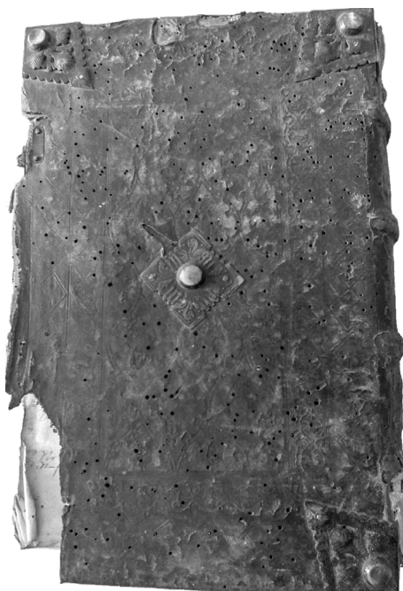
Il. 2. Okładzina dolna klocka zawierającego współprawne inkunabuły Inc. 93-97, BWSDK, fot. P. Kardys