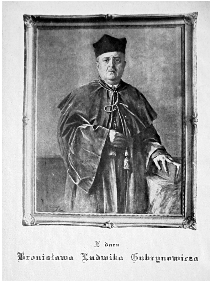
il. 1. Ekslibris portretowy Gubrynowicza ufundowany przez rodzinę po śmierci uczonego (SN PAN w Rzymie).