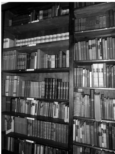
il. 3. Fragment kolekcji umieszczonej w pierwotnym przedwojennym regale (SN PAN w Rzymie).