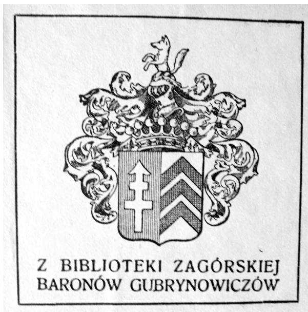
il. 2. Ekslibris biblioteki Gubrynowicza (SN PAN w Rzymie).