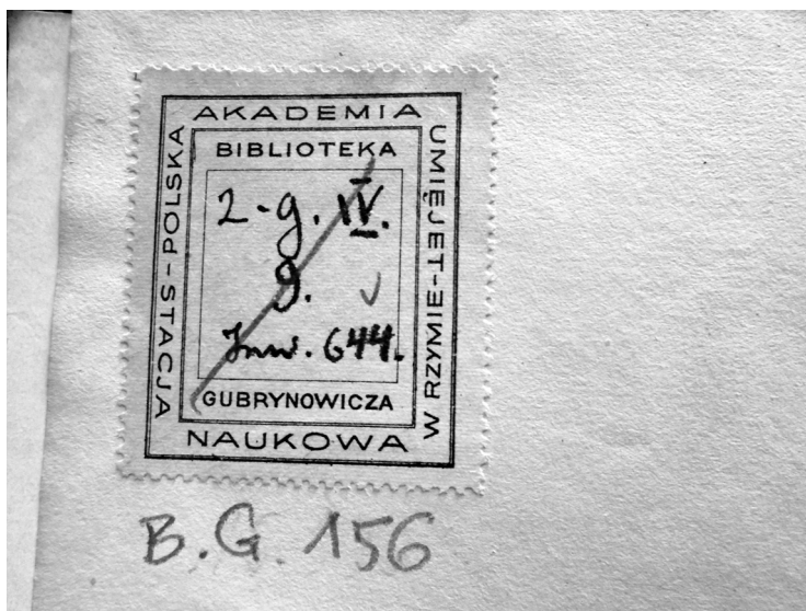
il. 5. Przedwojenna nalepka biblioteczna i współczesna korekta sygnatury (ołówkiem) (SN PAN w Rzymie).