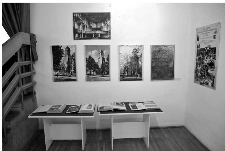
Fot. 3. Widokówki z kolekcji dra G. Biszczyńskiego przedstawiające budynek kościoła pw. Najświętszego Zbawiciela przed II wojną światową.