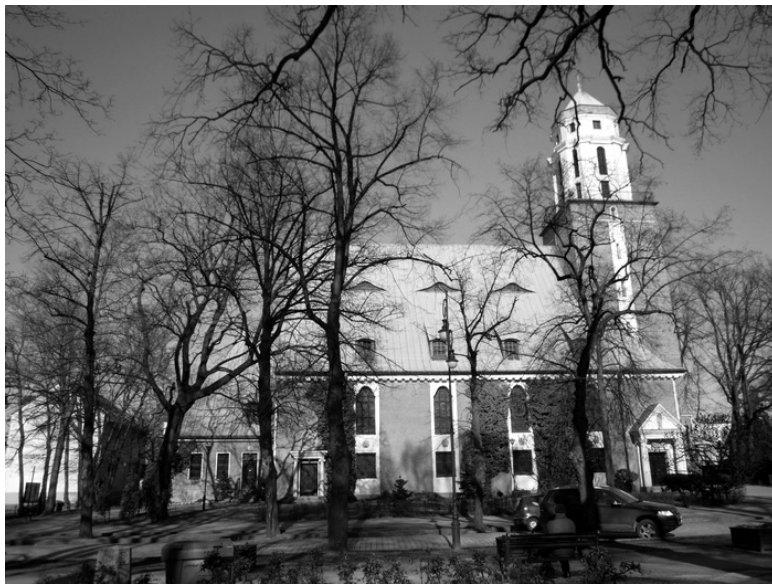
Fot. 1. Kościół pw. Najświętszego Zbawiciela w Zielonej Górze, 2017.

Do dziś „Zbawiciel” jest ważną w dziejach miasta świątynią, w której na przestrzeni lat odbywało się wiele wydarzeń związanych z życiem duchowym wiernych. O wspomnianych wydarzeniach, historii kościoła, parafii, działalności poszczególnych proboszczów, informowała wystawa prezentowana w Muzeum Ziemi Lubuskiej 37 . Złożyły się na nią plansze przedstawiające budowę obiektu, plany architektoniczne, dawny i obecny wygląd. Kościół pw. Najświętszego Zbawiciela od stu lat stanowi dominantę architektoniczną pejzażu miasta, ale jest także ważnym ośrodkiem życia duchowego i kulturowego. Gromadzi mieszkańców miasta, dla których wyznanie wiary było nie tylko wielopokoleniową tradycją, ale również głębokim przeżyciem duchowym. Duszpasterze głoszący tam Słowo Boże, od lat kształtują postawę zielonogórczan, pomagają wewnętrznej przemianie oraz sprawują pieczę na kultywowaniu etosu chrześcijaństwa jedności. Społeczność zrzeszona wokół tej świątyni od lat działa także na rzecz pomocy innym prezentując godną naśladowania postawę.