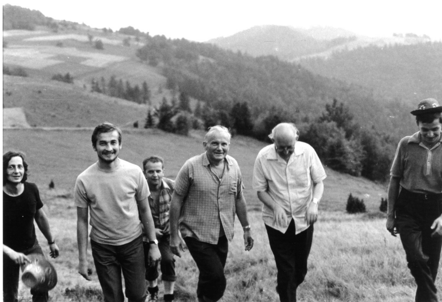
Fot. 1. Ks. kard. Karol Wojtyła i ks. Franciszek Blachnicki (z tyłu widoczny kapelan ks. kardynała ks. Stanisław Dziwisz) w drodze na dzień Wspólnoty na Górę Błyszcz.