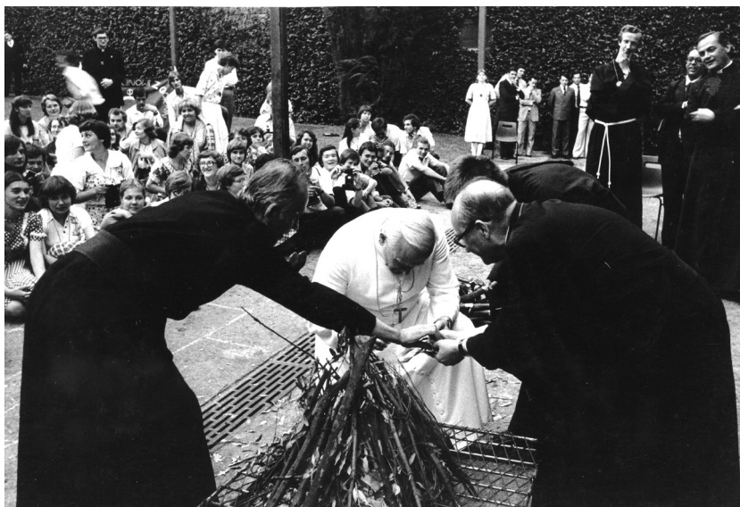
Fot. 3. Jan Paweł II z oazowiczami podczas pogodnego wieczoru w ogrodach Castel Gandolfo. I-sza Oaza Rzymska. 12 sierpnia 1979 r. Album I-sza Oaza Rzymska. Fot. nr 31.