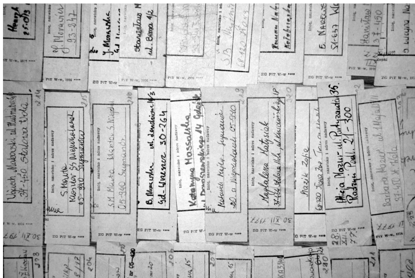
Fot. 5. Pokwitowania nadania paczek z węglem w ramach akcji „Koks”. 1977-1978. AGRŚ-Ż, Z.RŚ-Ż, T. Akcja „Koks”, grudzień 1977-styczeń 1978, sygn. 540004/1.