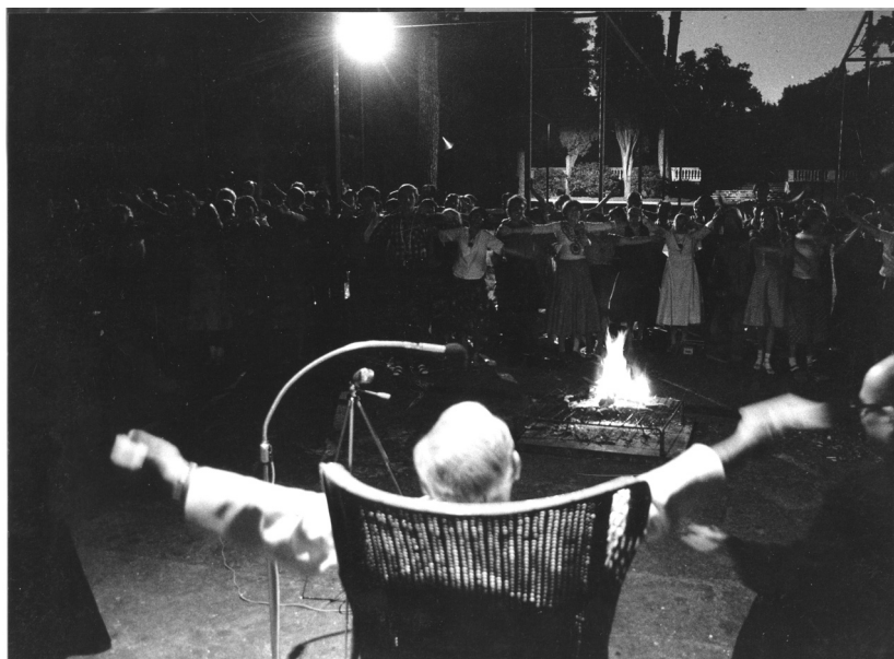
Fot. 4. Jan Paweł II z oazowiczami podczas pogodnego wieczoru w ogrodach Castel Gandolfo. I-sza Oaza Rzymska. 12 sierpnia 1979 r. Album I-sza Oaza Rzymska. Fot. nr 33.