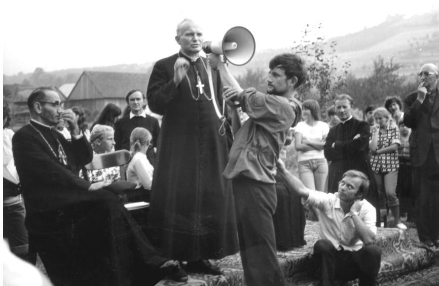
Fot. 2. Ks. kard. Karol Wojtyła podczas Dnia Wspólnoty w Tylmanowej. 18 sierpnia 1974 r. Fot. Marek Sznyk. AGRS-Ż, Fotografie, sygn. 1974/6/3.