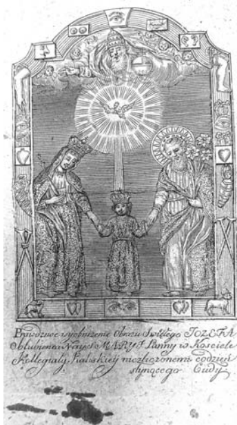
Il.10. Karta sztychowa, Cuda y Łaski , ks. S. Kłossowskiego, Kalisz 1780. Miedzioryt zachowany w egzemplarzach z Biblioteki Uniwersyteckiej w Warszawie, Biblioteki Jagiellońskiej w Krakowie i Biblioteki Katolickiego Uniwersytetu Lubelskiego.

nielicznych egzemplarzy tego „rara avis” tylko egzemplarze Biblioteki Uniwersyteckiej w Warszawie, Biblioteki Jagiellońskiej w Krakowie i Biblioteki Uniwersyteckiej KUL zachowały się z miedziorytem 28 . Po kwerendzie przeprowadzonej w polskich bibliotekach można uzupełnić tę informację. Jeden z dwóch egzemplarzy przechowywanych w Bibliotece Narodowej również zaopatrzony jest we wspomnianą kartę sztychową (czyli miedzioryt). Pozostałe stare druki bądź zostały pozbawione ryciny, bądź też ilustracje zostały puszczone w obieg w niewielu egzemplarzach. Niesygnowany miedzioryt, stanowiący rodzaj frontyspisu przedstawia kaliski cudowny wizerunek w srebrnych sukienkach, ze zdobiącymi ramę obrazu plaketami wotywnymi oraz wotami w postaci pary skrzyżowanych kul, stanowiących podpory dla chromych. Pod ilustracją znajduje się napis: Prawdziwe wyobrażenie Obrazu Świętego JOZEFA / Oblubieńca Najś: [świętszej] MARYI Panny w Kościele / Kollegiaty Kaliskiej niezliczonemi codzeń / słynącego Cudy.