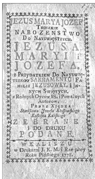
Il.2. Jezus Maryja Józef. Trojaki nabożeństwo do najświętszych Jezusa Maryi i Józefa... , Kalisz 1778.