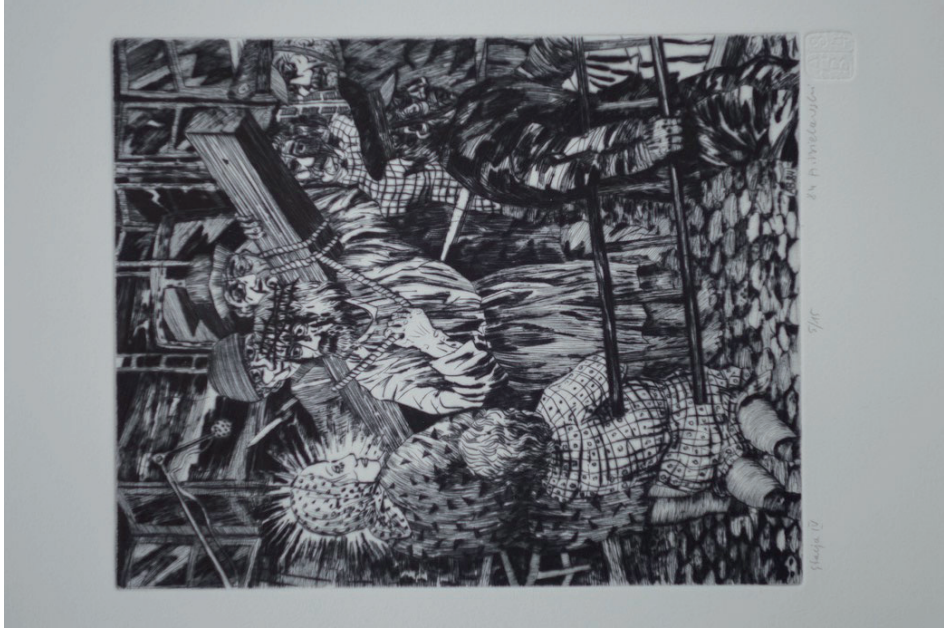
4. Andrzej Bielawski, Stacja IV, Jezus spotyka Matkę , z cyklu Droga krzyżowa , 1984, sucha igła.