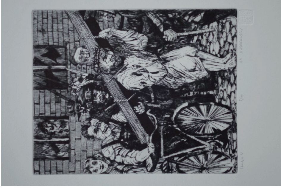
5. Andrzej Bielawski, Stacja V, Szymon Cyrenajczyk pomaga nieść krzyż Jezusowi , z cyklu Droga krzyżowa , 1984, sucha igła.