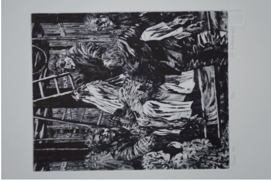
13. Andrzej Bielański, Stacja XIII, Zdjęcie z krzyża , z cyklu Droga krzyżowa , 1984, sucha igła.