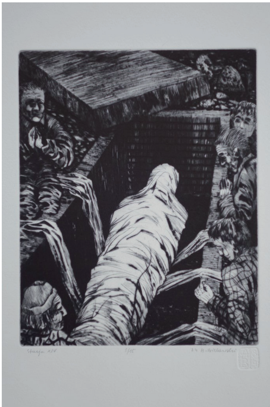
14. Andrzej Bielawski, Stacja XIV, Złożenie do grobu , z cyklu Droga krzyżowa , 1984, sucha igła.