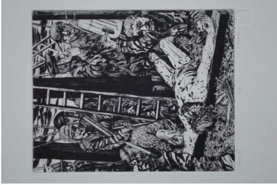
11. Andrzej Bielański, Stacja XI, Jezus przybity do krzyża , z cyklu Droga krzyżowa , 1984, sucha igła (fot. K. Kopania).