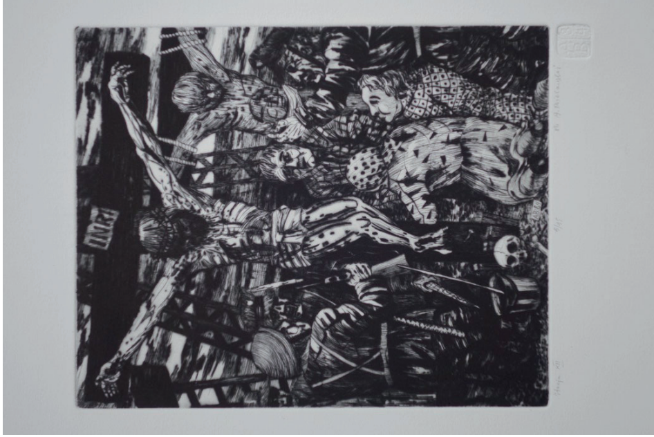
12. Andrzej Bielański, Stacja XII, Jezus umiera na krzyżu , z cyklu Droga krzyżowa , 1984, sucha igła (fot. K. Kopiańia).