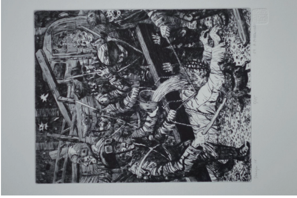
9. Andrzej Bielawski, Stacja IX, Trzeci upadek Jezusa , z cyklu Droga krzyżowa , 1984, sucha igła.