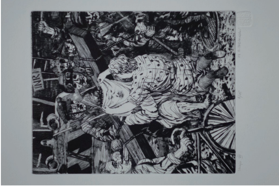
6. Andrzej Bielawski, Stacja VI, Święta Weronika ociera twarz Jezusa , z cyklu Droga krzyżowa , 1984, sucha igła (fot. K. Kopiania).