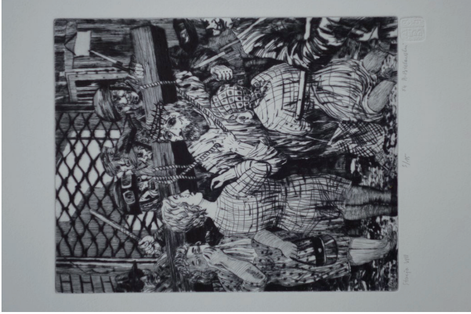
8. Andrzej Bielawski, Stacja VIII, Jezus pociesza niewiasty , z cyklu Droga krzyżowa , 1984, sucha igła.