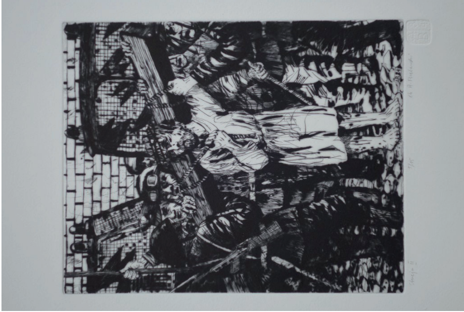
2. Andrzej Bielawski, Stacja II, Jezus bierze krzyż na ramiona , z cyklu Droga krzyżowa , 1984, sucha igła (fot. K. Kopiańia).