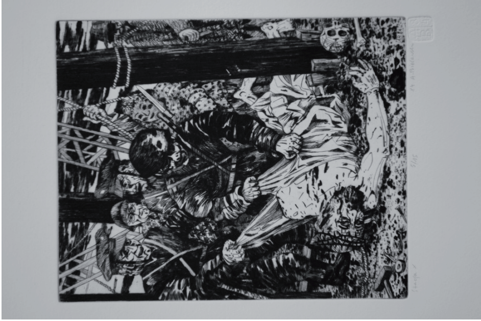
10. Andrzej Bielański, Stacja X, Jezus obnażony z szat , z cyklu Droga krzyżowa , 1984, sucha igła (fot. K. Kopania).