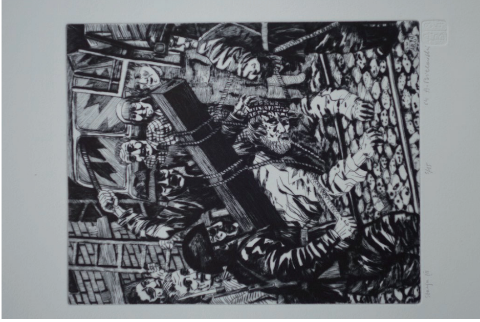
3. Andrzej Bielawski, Stacja III, Jezus upada pod krzyżem , z cyklu Droga krzyżowa , 1984, sucha igła.