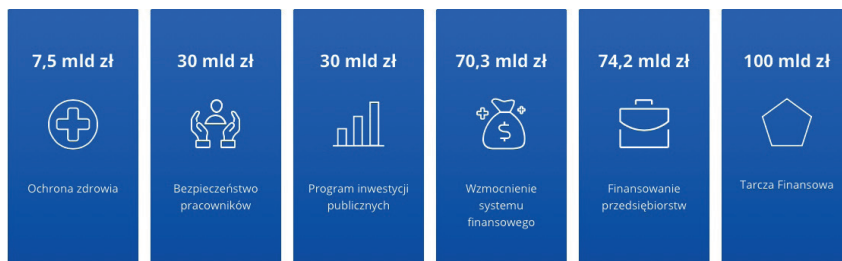
Rysunek 2. Szacowany budżet tarczy antykryzysowej

Według szacunków rządowych ogółem na walkę z pandemią przewidywane jest wydanie 312 mld zł, które skupione są w następujących obszarach (Tarcza antykryzysowa, 2021):