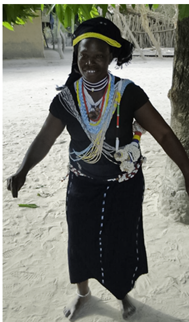
Fot. 1a i b. Kobiety kañaalen noszące symbole płodności 24

Uwaga skupiona była nie tylko na żyznej i mistycznie pielęgnowanej ziemi, ale również na prokreacji kobiet. Stąd rytuał kobiet nazywany kañaalen . Dotyczy on kobiet, które nie mogą zająć w ciążę lub mają skłonności do utraty dzieci. Uważane są za ofiary złych duchów. Aby pomóc im wyleczyć się z tej klątwy, zostają przeniesione ze wspólnoty małżeńskiej do innej rodziny mieszkającej w innej dzielnicy lub wiosce. W miejscowościach przyjmujących są one powierzone albo starszyźnie wioski, albo stowarzyszeniom mężczyzn i kobiet, którzy są odpowiedzialni za ich ochronę i pomoc w uzdrowieniu z prześladowanej ich klątwy. Oprócz wygnania w celu zatarcia śladów zmieniają także nazwiska.