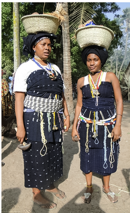
Fot. 3. Kobiety w trakcie przygotowań do kacinen (Diola Bandial)