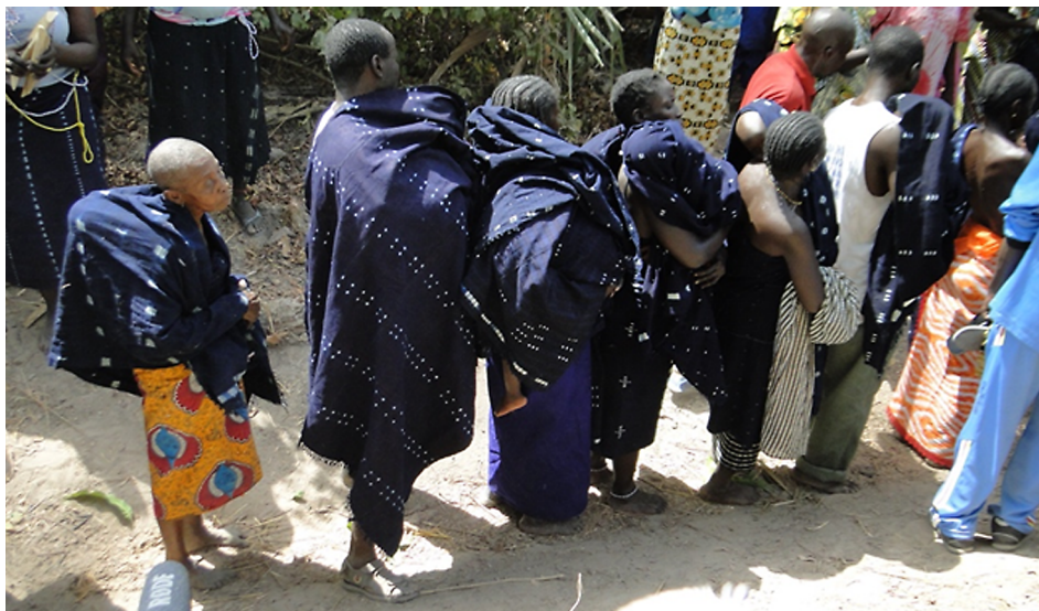
Fot. 2. Uczestnicy ceremonii przedinicjacyjnej ėsin (Baynounk Gubahėer)