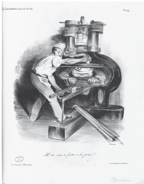
Figure 3. Daumier, « Ah ! tu veux te frotter à la presse !! », La Caricature , 3 octobre 1833. Les musées de la Ville de Paris.

de travail et expression de sa liberté, Daumier a créé toute une épopée en images sur les relations entre la presse et le pouvoir 7 . Le dessinateur n'avait pas de doute quant à la puissance des journaux : en jouant sur les mots dans le titre de la caricature « Ah ! tu veux te frotter à la presse !! » (fig. 3), il a averti le roi Louis-Philippe du risque qu'entraînerait son attentat à la liberté de la presse. Le pouvoir dont disposent les directeurs de journaux et qui favorise la corruption, a été bien illustré par Robert Macaire Journaliste qui, guidé par la logique du gain, adresse des propos trompeurs à ses créanciers en les menaçant d'une attaque en diffamation (fig. 4).