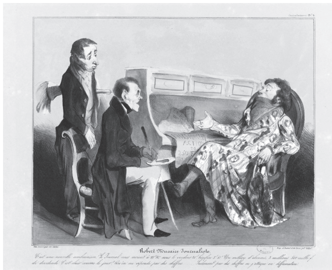
Figure 4. Daumier « Robert Macaire Journaliste », Le Charivari , 10 septembre 1836. Les musées de la Ville de Paris.

Daumier a également relevé l'influence de la presse sur la vie sociale. Aussi, ses caricatures représentent-elles