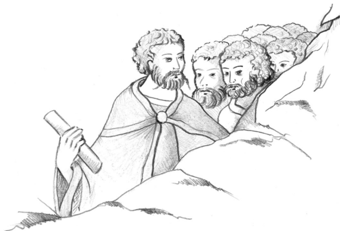
Rys. 1. Mahomet w gronie swoich uczniów. Fragment miniatury z rękopisu PHB, F.IV.151 (fol. 677). Odrys: E. Myślińska-Brzozowska.